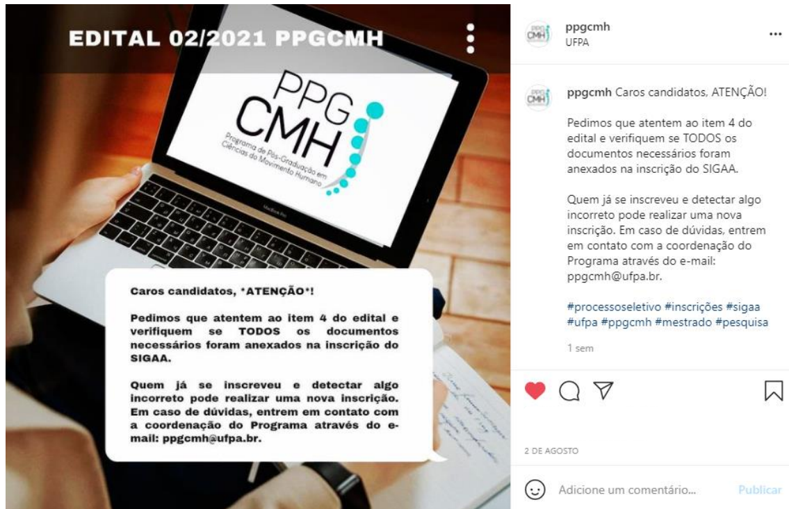
Figura 1: Post no INSTAGRAM informando aos candidatos sobre a inscrição no sistema SIGAA.